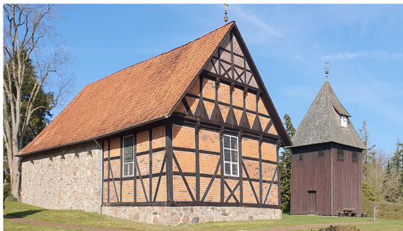
Spielstätte St. Magdalenen Undeloh