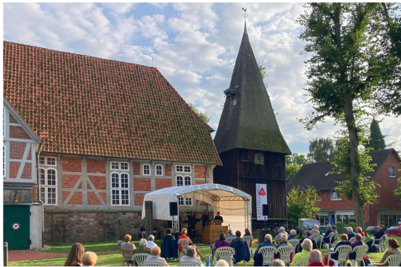
Spielstätte St. Stephanus Egestorf